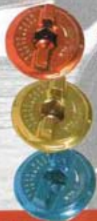
TAPPO OLIO ENGINE OIL PLUG

Il primo kit di accessori per Yamaha T-Max firmata STM. Tutti interamente ricavati dal pieno, in Anticorodal 6082. Tutto i particolari sono disponibili nei seguenti colori: Blu, Oro, Nero e Rosso.