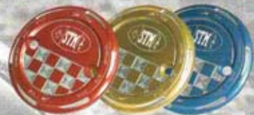
CARTER VARIATOR COVERS

The first accessory kit for Yamaha T-Max manufactured by STM. All the parts are totally billet machined in Anticorodal 6082. Parts are available in 4 colours: Blue, Gold, Black and Red.