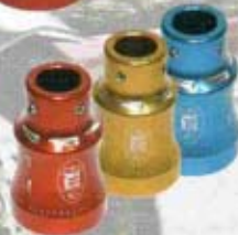
COPRIMOZZO SMALL REAR WHEEL HUB COVER SMALL VERSION