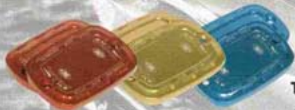
TAPPO OLIO FRENI FLUID RESERVOIR PLUG