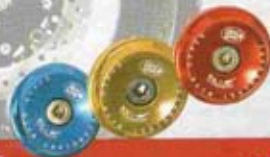
TAPPI FORCELLA & FORCELLONE FRONT SPINDLE PROTECTOR & SWINGARM PLUG