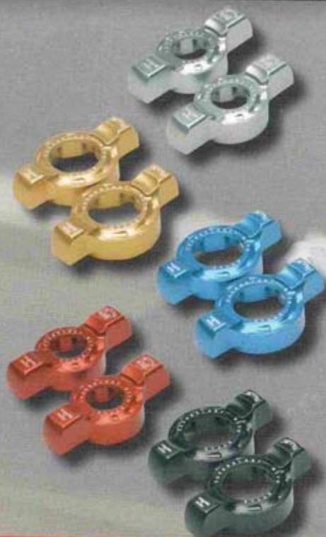
REGOLATORE FORCELLA FORK ADJUSTER

DISPONIBILI PER: AVAILABLE FOR: Kayaba Marzocchi Ohlins Showa