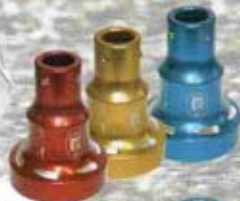
COPRIMOZZO BIG REAR WHEEL HUB COVER BIG VERSION